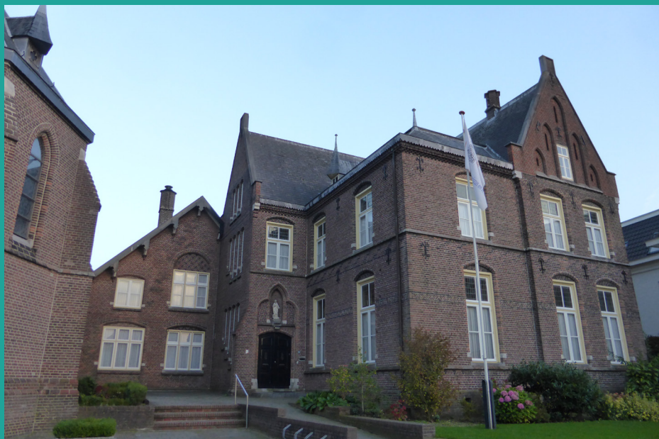
Pastorie van de parochie H. Franciscus en H. Clara